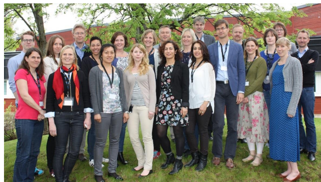
Deltagare vid ett FBD-möte.